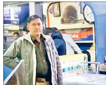
रोहतक। जांच के लिए पहुंची पुलिस टीम।