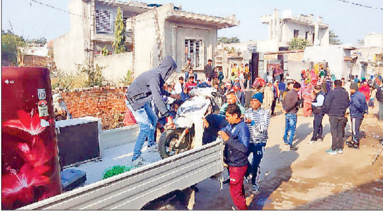
रोहतक। एक घर से सामान जब्त करने के बाद वाहन पर लोड करते पुलिस कर्मचारी।