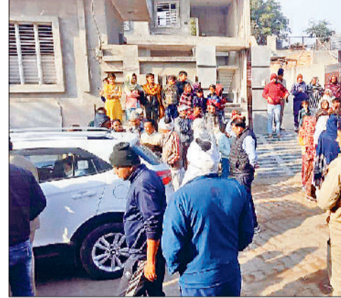
रोहतक। छापेमारी करने पहुंची पुलिस की टीम।