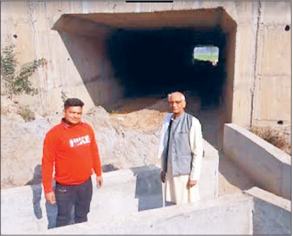
रोहतक। गांव रिटाल में बंद नहरी पानी को दिखाते हुए लोग।

निर्माणधीन दिल्ली- कटड़ा राष्ट्रीय राजमार्ग की वजह से रोहतक के गांव रिटाल की करीब पांच सौ एकड़ कृषि भूमि को दो साल से नहरी पानी नहीं मिल पा रहा है। परेशान किसान इस बारे में संबंधित कंपनी व स्थानीय अधिकारियों से गुहार लगा चुके हैं लेकिन उनकी कोई सुनवाई नहीं हो रही है। जेएलएन के निकट स्थित गांव रिटाल के खेतों से यह राष्ट्रीय राजमार्ग निकल रहा है। निर्माण कार्य जोरों पर है लेकिन सिंचाई विभाग की ओर से स्थापित जिस मोगे से यहां के खेतों को पानी मिल रहा था, वह अवरूद्ध है। राष्ट्रीय राजमार्ग पर पुलिस नंबर 30971 है। इसके नीचे से जेएलएन के मोगा नंबर 230 से करीब पांच सौ एकड़ कृषि भूमि