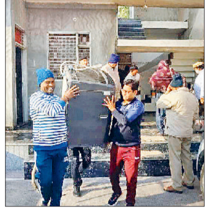
रोहतक। सामान को ले जाते पुलिस कर्मचारी।

का गठन किया गया। छापेमारी में सीआईए-1, सीआईए-2, एएनसी व पीओ स्टाफ की टीम भी शामिल रही हैं। छापेमारी में 200 से ज्यादा जवान शामिल रहे।